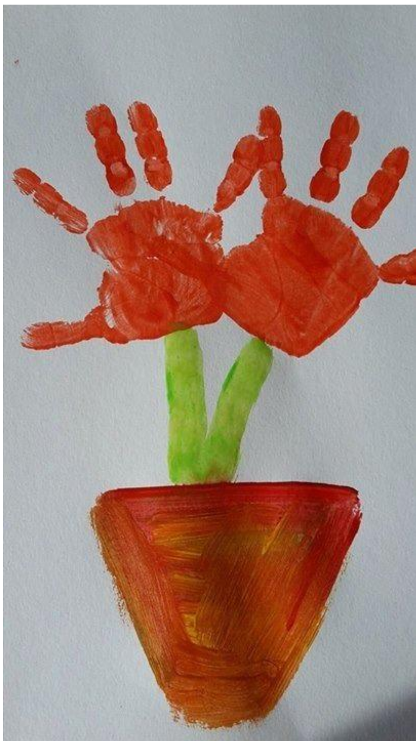
Obtisk ruky vytváření květiny