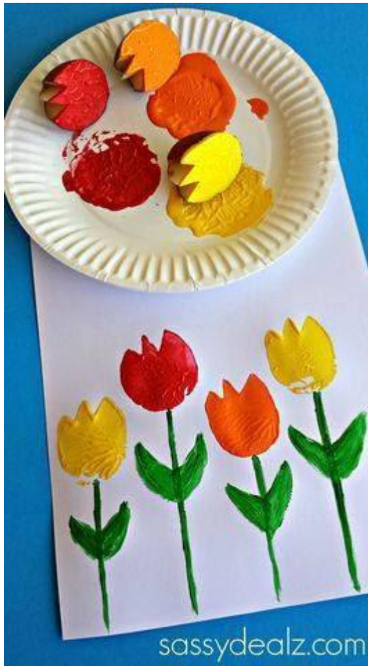
Kytička vytvořená pomocí tyčinek do uší a trochou modelíny