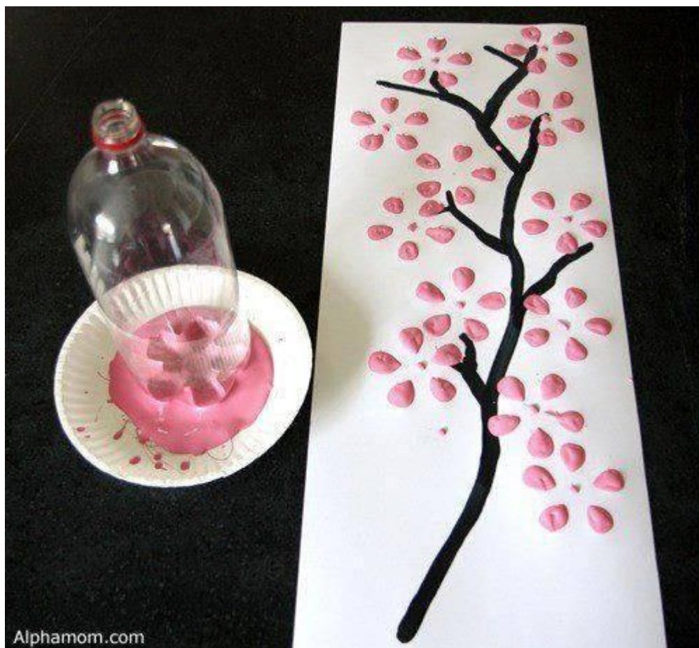
Květiny tiskátko- plastová lahev- barva