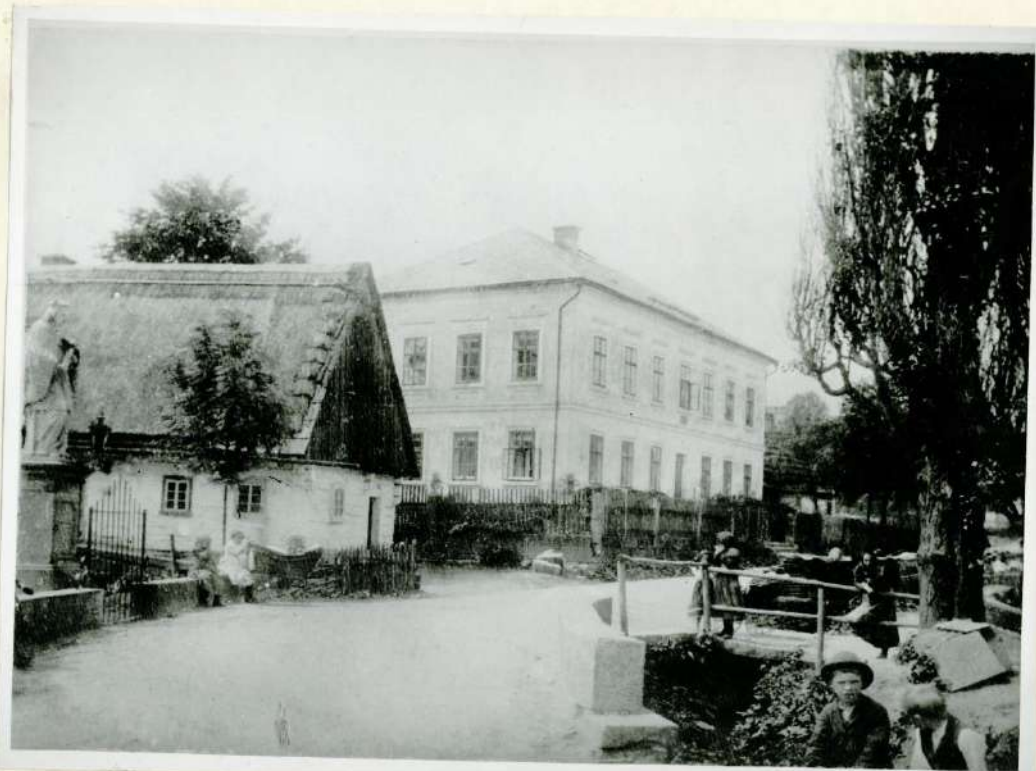
Skola a Jenkova chalupa č.p. 88 r. 1935 (obrácený negativ)