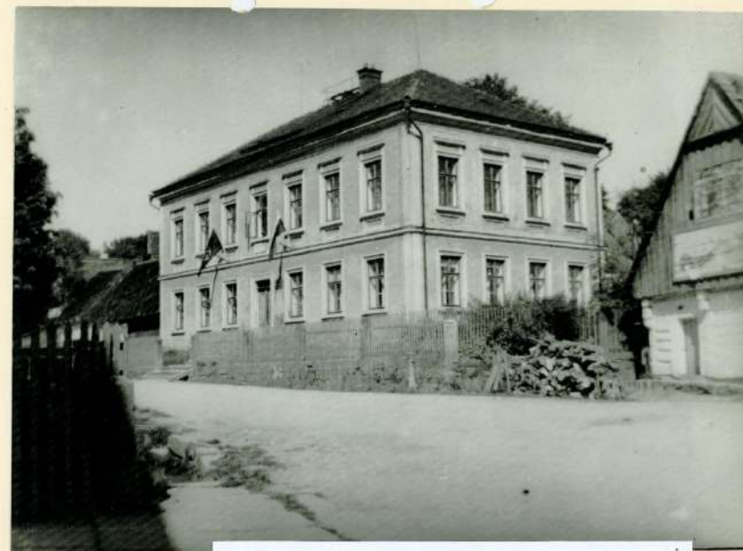
Suchodolská škola v roce 1940, vpravo č.p. 88