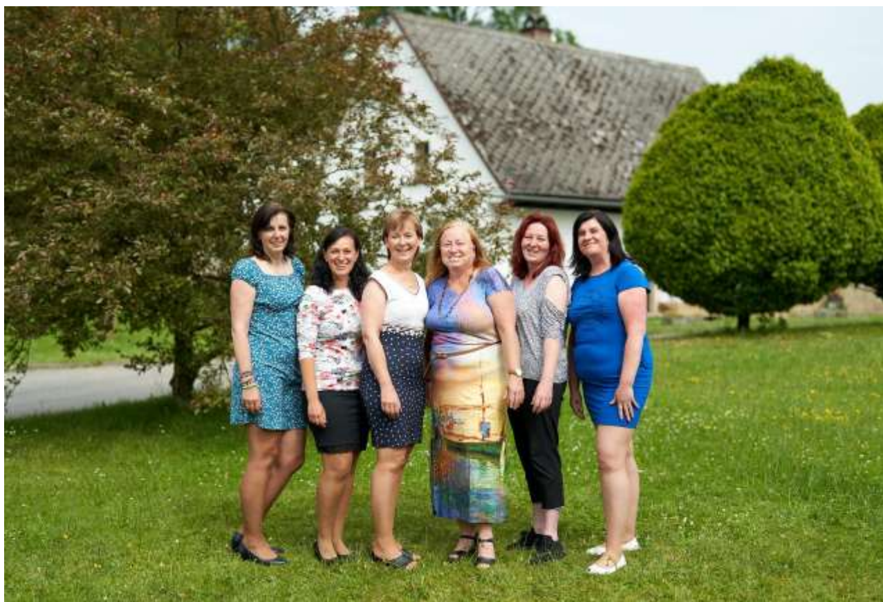
.. Pracovníci školy